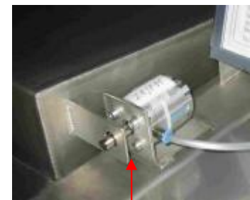
verrouillage automatique du couvercle