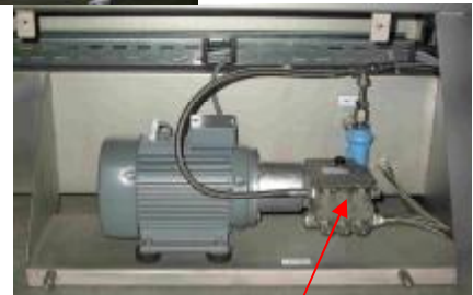
pompe à haute pression