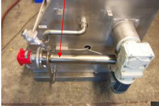
chauffage par circulation